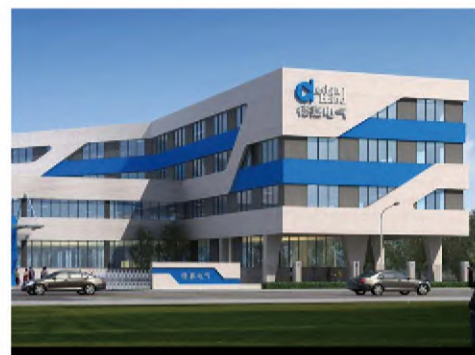
德嘉电气（滁州）有限公司项目