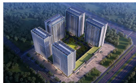
高速公路新沂服务区改扩建项目鸟瞰图