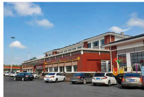
南京市宁海中学体育馆改造工程