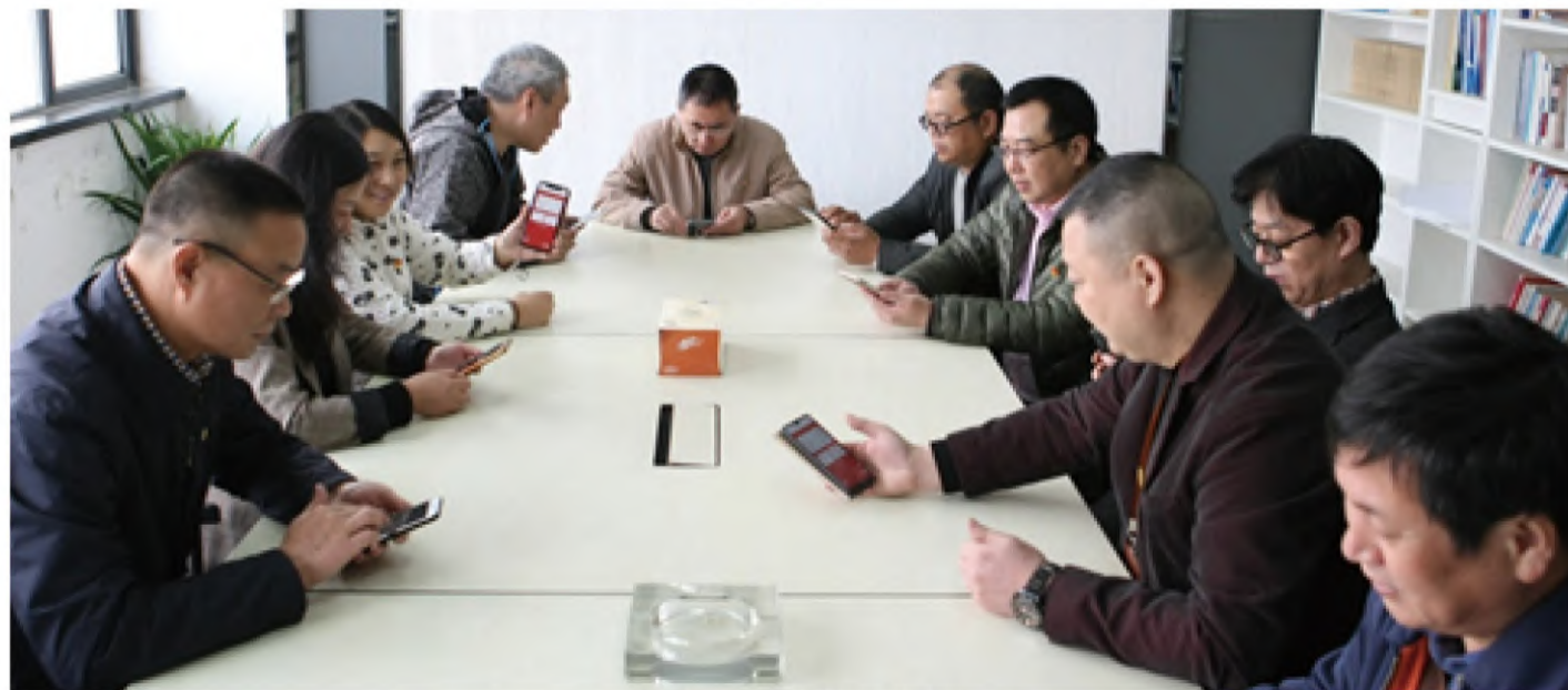
图为学习中心组集中讨论

“学习强国”学习平台是由中央宣传部组织建设，是推动习近平新时代中国特色社会主义思想学习宣传贯彻不断深入的重要举措，是党中央根据新时代宣传思想文化工作面临的新形势新使命新任务提出的重要抓手，也是新形势下强化理论武装和思想教育的创新探索。