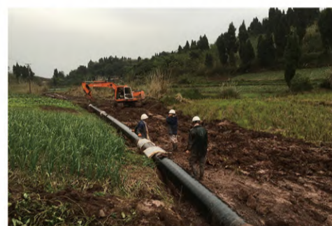
绍兴市滨海大道天然气管道延伸工程